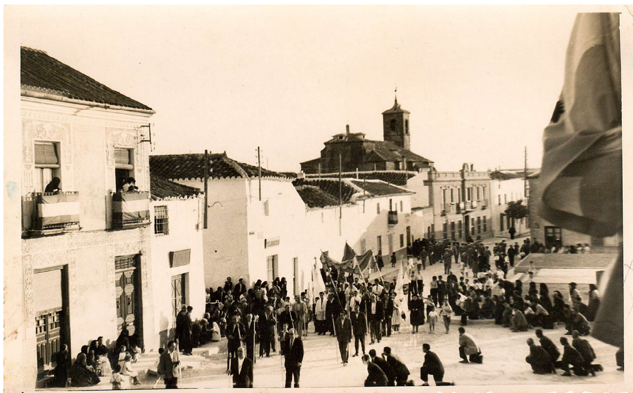
Día del Señor de los años cincuenta del siglo pasado. Fondos de la Asociación