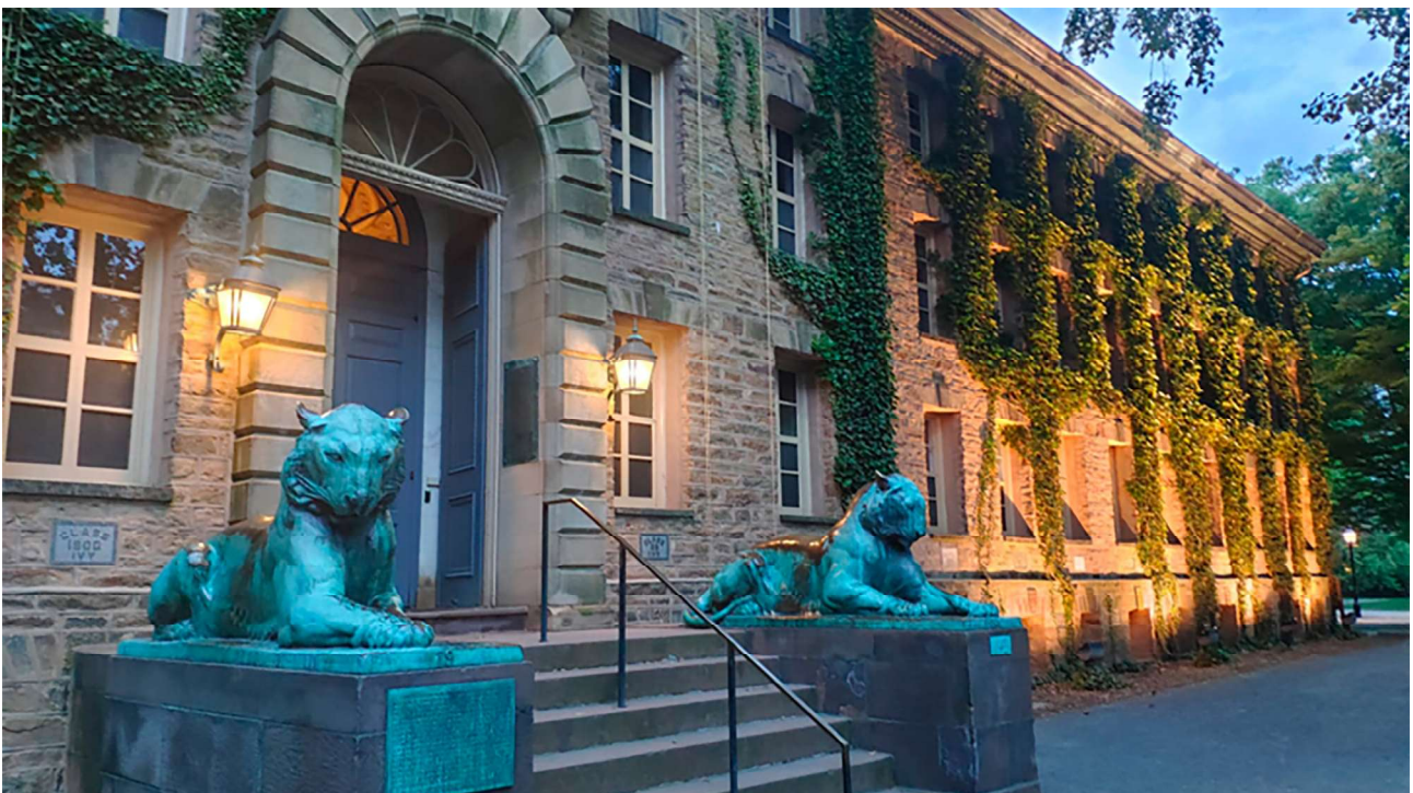
Universidad de Princeton (EE. UU.).