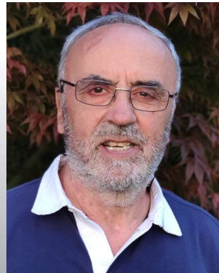
Por José Manuel González Mujeriego Miembro de la Asociación de Amigos por la Historia de Mota del Cuervo

Nos centraremos principalmente en el Quijote y en determinados personajes o localizaciones que cita Cervantes en la Mancha y que existieron realmente.