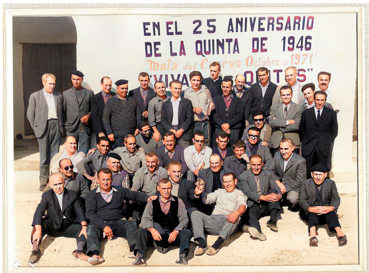
Quintos de 1946, nacidos en 1925 y reunidos en 1971. Coloreada con Inteligencia Artificial.