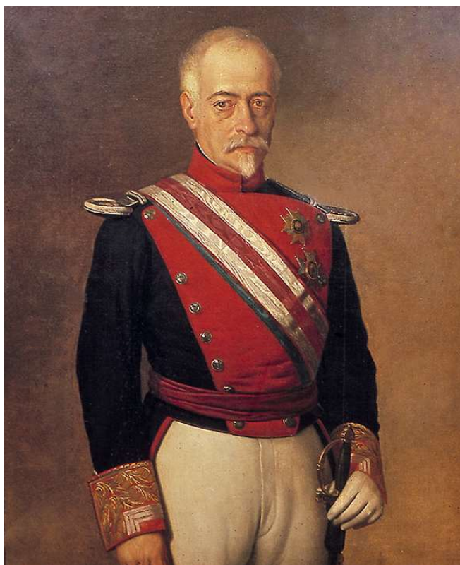
Don Francisco Javier Girón y Ezpeleta, II Duque de Ahumada

A mediados del siglo XIX, cuando se creó la Guardia Civil, las escaramuzas y el número de delitos sufridos por la población eran muy altos, y los alguaciles locales poco podían hacer ante bandas de malhechores, más o menos organizadas, que operaban en gran parte del territorio y que se mudaban de sitio más fácilmente que los alguaciles podían hacerlo. Ante esto, solo quedaba movilizar al ejército, pero España estaba inmersa en conflictos militares y sociales en el siglo XIX, pues prácticamente acababa de terminar la Guerra de la Independencia contra los franceses (1808-1814), y el ejército, lejos de gozar de prestigio ante los gobiernos posteriores de Fernando VII, estos desconfiaban de él, y comenzaron diversos pronunciamientos militares, como los de los Generales Díaz Polier, Lacy, Milans del Bosch, y Espoz y Mina, entre otros.