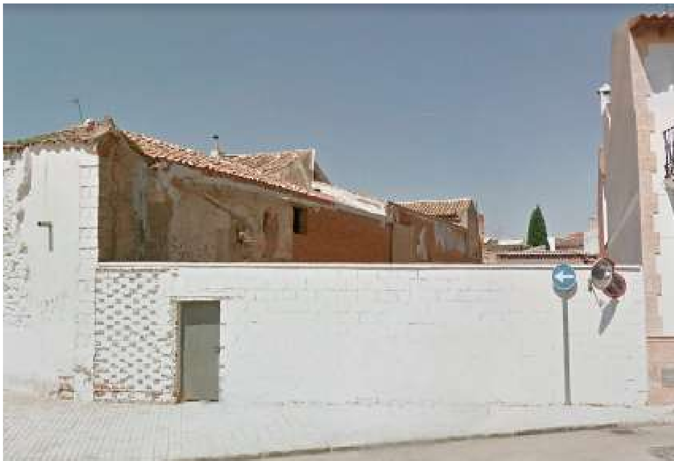
Parte posterior del antiguo cuartel, hoy un solar.