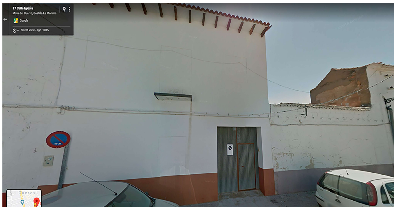
Lugar donde estaba el antiguo cuartel de la calle de la Iglesia, número 13.

Como vemos en la imagen, la antigua casa cuartel se encontraba aquí, pero se derrumbó y solo queda ese edificio en desuso y la pared de la derecha tapando un solar. Por la parte de detrás, donde daba el patio y el corral, tampoco vemos vestigios de lo que fuera el cuartel.